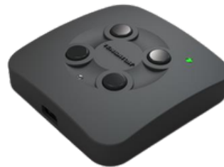
Commande par bouton